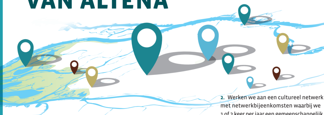
Interactieve kaart alle culturele instellingen en activiteiten.